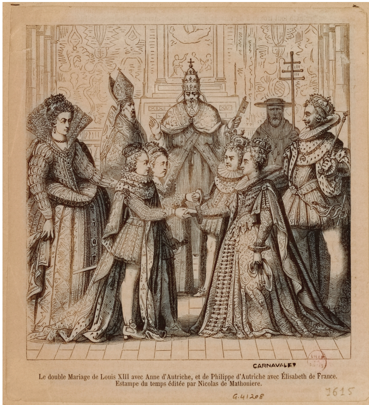
FIGURA 1. Noces d'Anna d'Àustria amb Lluís XIII i de Felip IV amb Isabel de Borbó.

«Los matrimonios españoles de 1615» 9 generaren una gran quantitat d'impressions: cròniques, assaigs, poesia cortesana, prosa apologètica, comèdies, relacions de successos, gravats, emblemes i quadres commemoratius, tant a França com a Espanya.