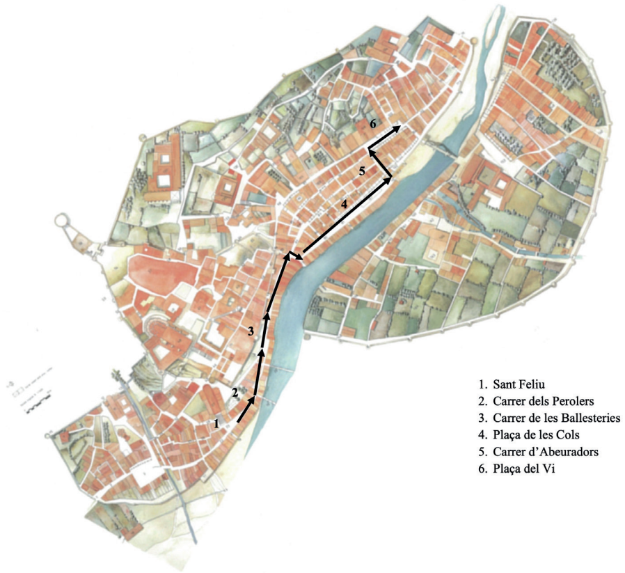
FIGURA 4. Recorregut del seguici amb motiu de les noces d'Anna d'Àustria amb Lluís XIII de França i de Felip IV amb Isabel de Borbó, el diumenge 19 desembre de 1615.